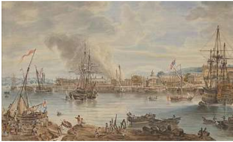
Chathameko Ontziola 1790an, Nicholas Pocock

koz ere landuagoa tailuei eta pinturei dagokienez.