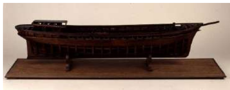
Merkataritza-bergantin baten kroskoaren eredu ontzitegiaren gainean (c.1850) [MNM-5205] Bi zubi adarretan eta harmailetan dituen itsasontzi-eredua [MNM-2639]