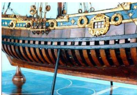
Yate Real Henrietta, detailea. (1679)

Horrela, hainbat jaberren eskutatik igaro ondoren, Henry Huttleston Rogersen bildumara iritsi ziren. Haren aita kapitaina zen, 1620an Mayflower ontziko jatorrizko erro-mesen ondorengoa, eta baita kapitain eta Rockefellerren bazkidea eta lehiakidea ere Standard Oilen. Henry Huttleston Rogers hil zenean, eredu haiek Amerikar Ontzidiaren Museoaren bildumara igaro ziren.