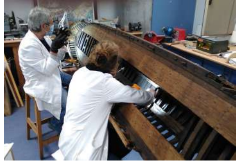
Zaharberritzeko prozesuan dagoen Itsasmuseumeko bildumako adar erdiko ereduak

ko alboa estali gabe uzten da oro har, egituraren erakuntza xehetasunak agerian uzteko, hala nola gilagaina, kostilak, bularraren barrualdea, korasta, etab.