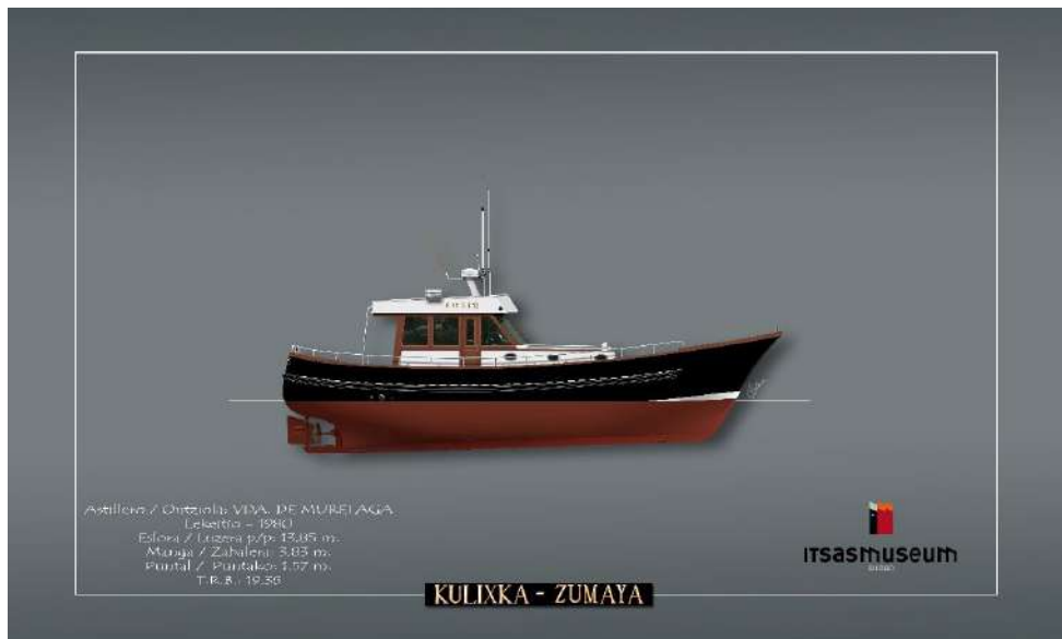
Carlos Pueyo Itsas Museumeko boluntarioak marraztutako ontziaren irudia