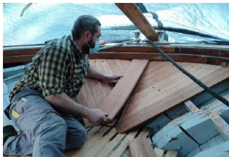
Brankako enbonoa egitea