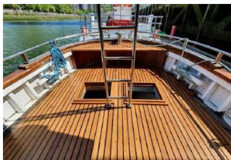
Popako aldearen ikuspegia kubiarta bernizatu ondoren