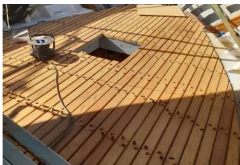
Kubiertaren brankako gunea, bikeztatu gabe Enbono zaharra kendu behar izan zen kubierta berregiteko