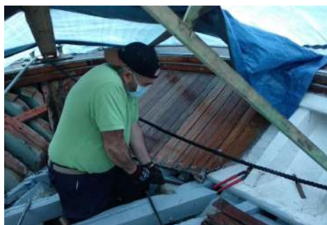
Brankako baoak prestatzea