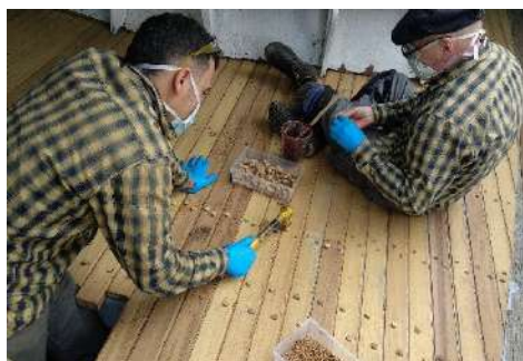
Kubiertako tirafondoetako zuloak estaltzeko ziritxoak jartzea