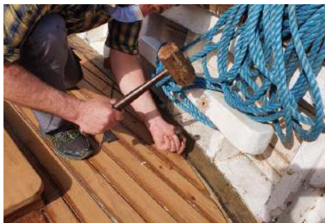
Trankanil-estalkiaren eta kubiartaren arteko juntura kotoiarekin bikeztatzea