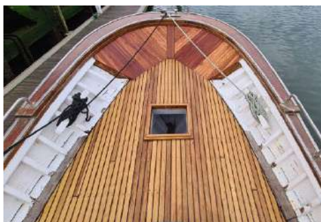
Brankako aldearen ikuspegia kubiarta bernizatu ondoren