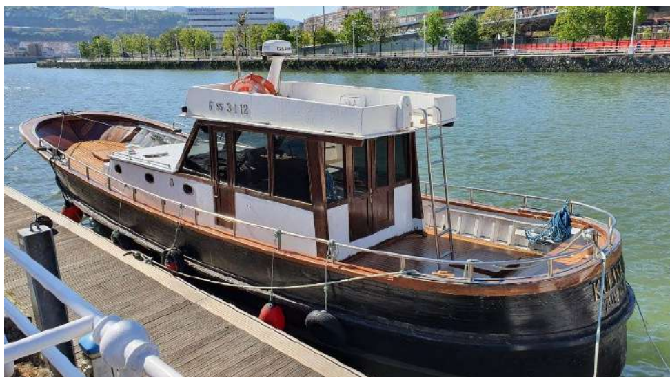
Ontziaren ikuspegia, popa, kubiertoak lana amaitu ondoren