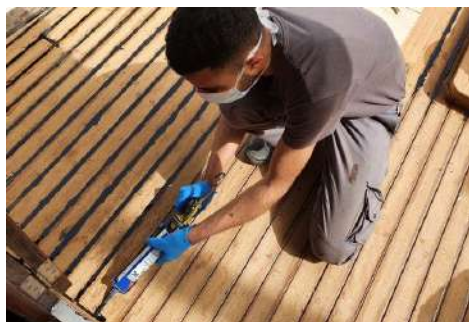
Estalki-junturak zigilatzea eta lixatzea Sikaflex 290 Dc Prorekin